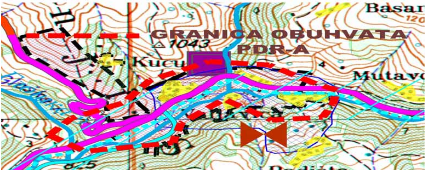
Графички приказ: Граница обухвата Плана детаљне регулације за изградњу водоводне мреже и канализационе мреже са постројењем за пречишћавање отпадних вода у Доњем Стајевцу