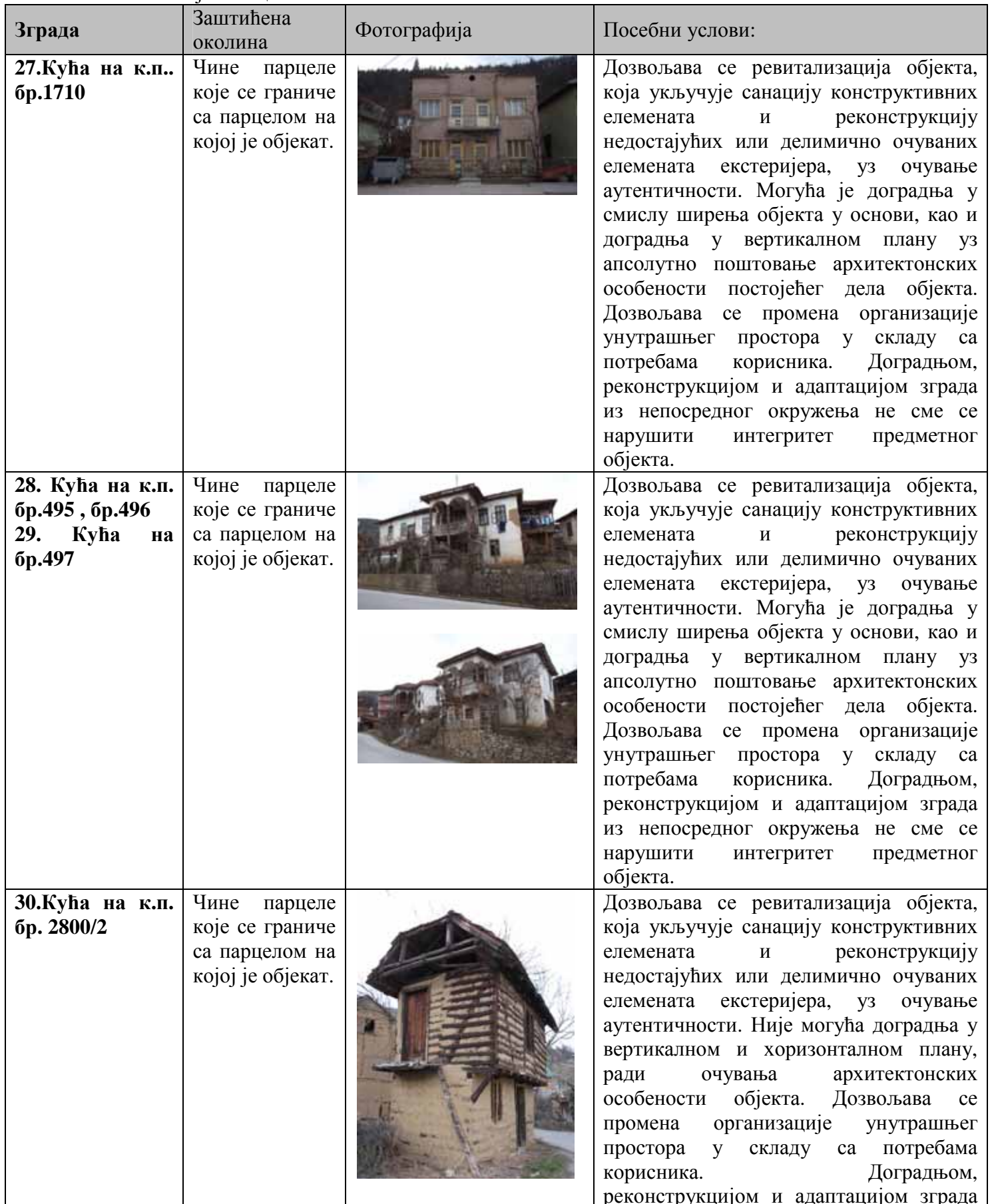
Табела 9 - Насеље Рајчиловци

Препорука је да се код евентуалних интервенција на овим зградама пројектантима предоче њихове вредности у циљу очувања и унапређења амбијента у ком се налазе и формирања свеобухватнијих просторних целина. Ово се односи пре свега на зграде на катастарским парцелама : бр.310, бр.316, бр.317, бр.320, бр.597/2, бр.599, бр.609/2, бр. 653, бр.664/1.