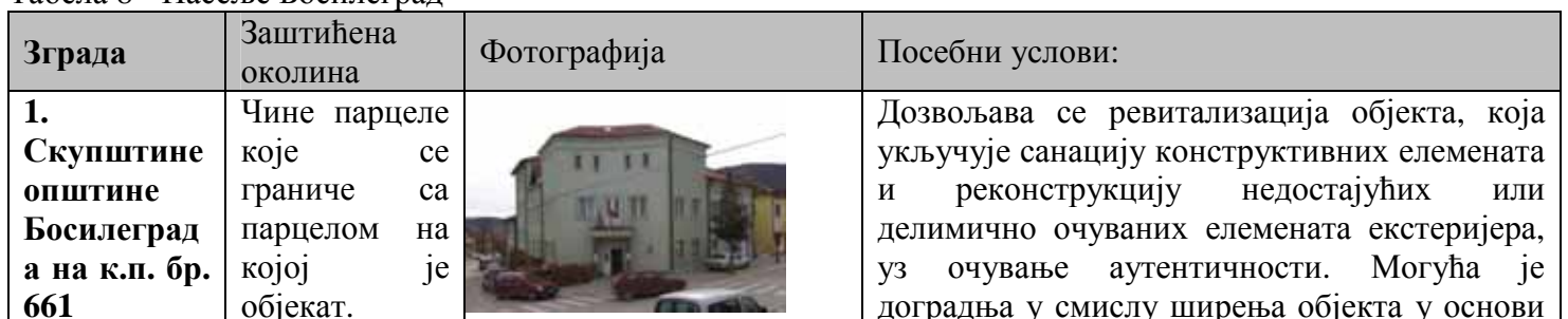
Табела 8 - Насеље Босилеград