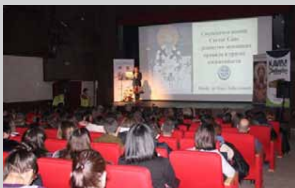
Предавање о Студеничком типуку Светог Саве