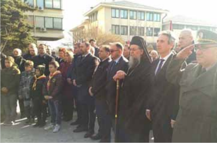
Полагање венаца на Споменик Чика Мити