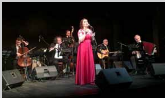
Концерт Иване Тасић