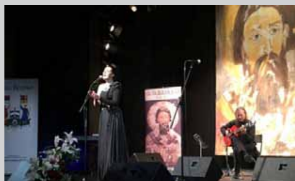
Концерт Данице Крстић