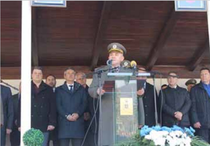
Свечаност у касарни „Први пешадијски пук књаза Милоша Великог“