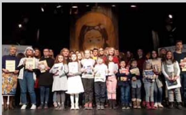
Додела награда учесницима Светосавских конкурса