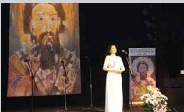
Концерт Јадранке Јовановић