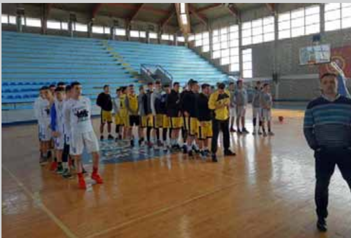
Бројне спортске активности