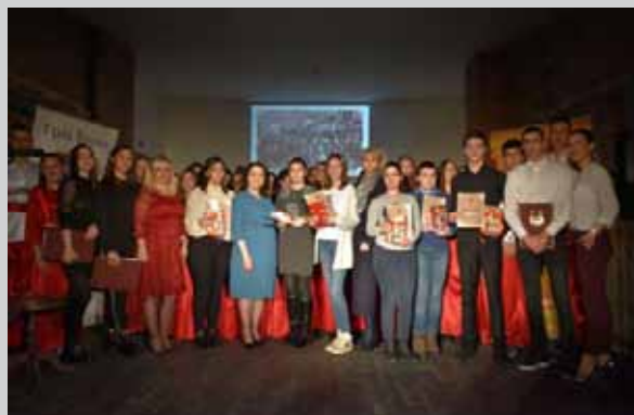
Додела награда учесницима конкурса „Врање, град у коме станује сећање на борбена срца“