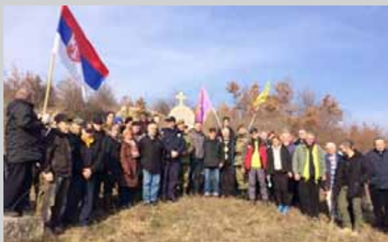
Марш до Осатице „Стазама ослободиоца Врања из 1878. године“