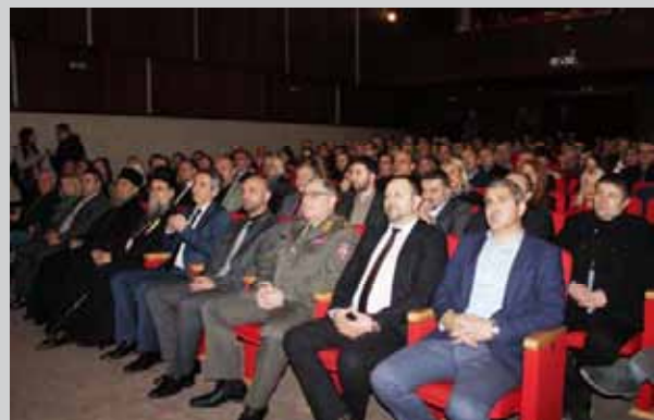
Свечано отварање манифестације