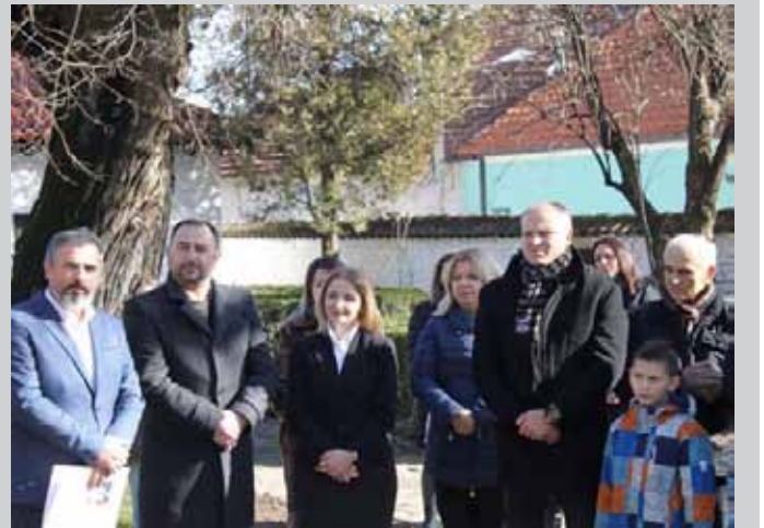
Представљена нова стална поставка Спомен собе у Музеј кући Боре Станковића