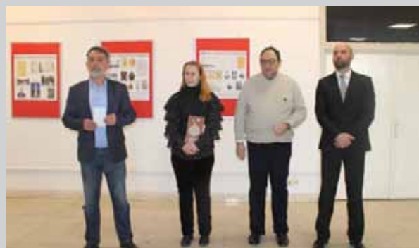
Изложба Тимочка крајина и Средње Поморавље у српско-турским ратовима