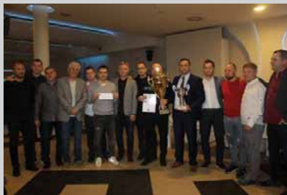
Избор најбољих у врањском спорту у 2019. години