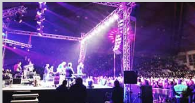
Концерт Сергеја Ђетковића