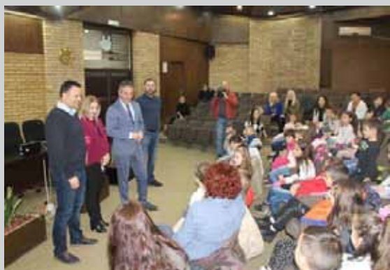
„Град отвореног срца“ пријем за децу ПУ „Наше дете“