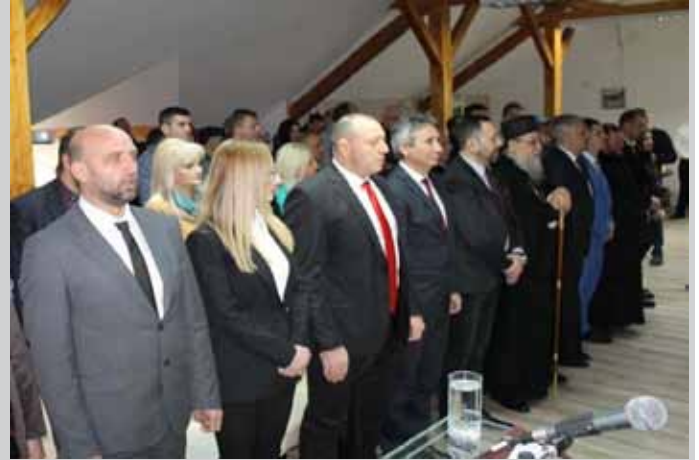
Седница Скупштине ГО Врањска Бања