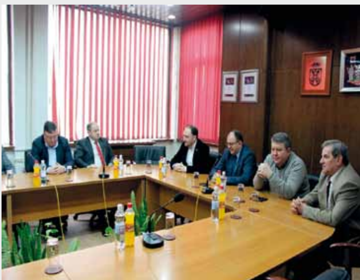
Пријем за представнике БИА-е и ПУ