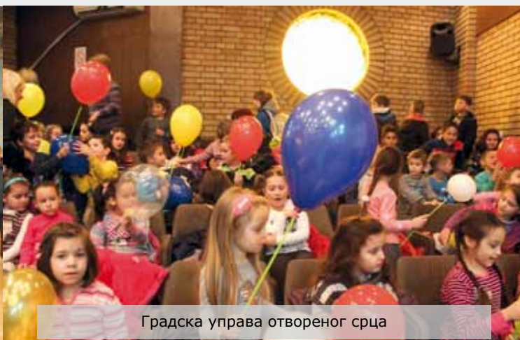
Градска управа отвореног срца