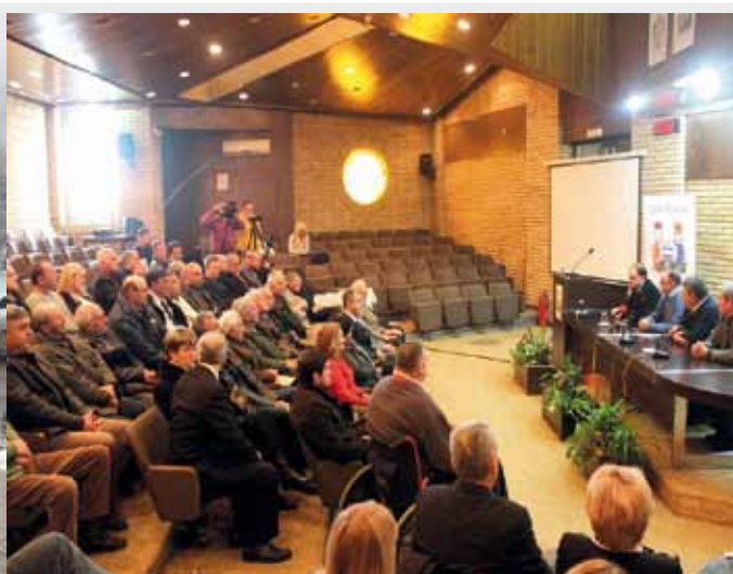
Пријем за представнике удружења грађана