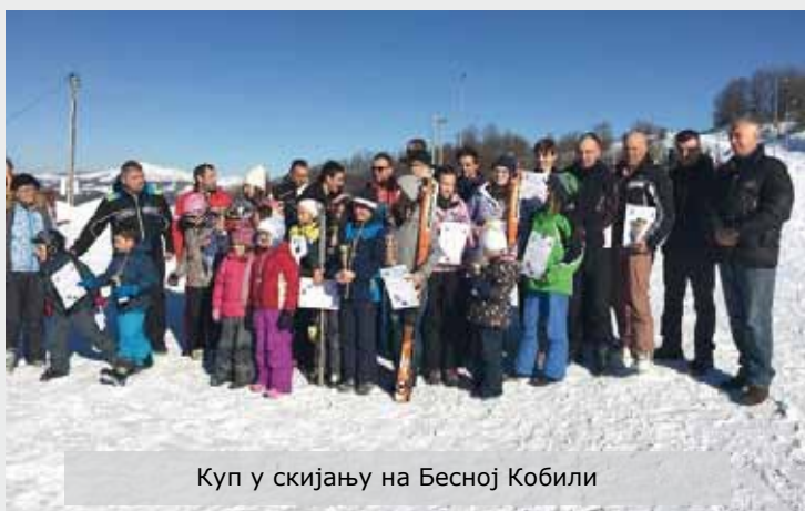
Куп у скијању на Бесној Кобили