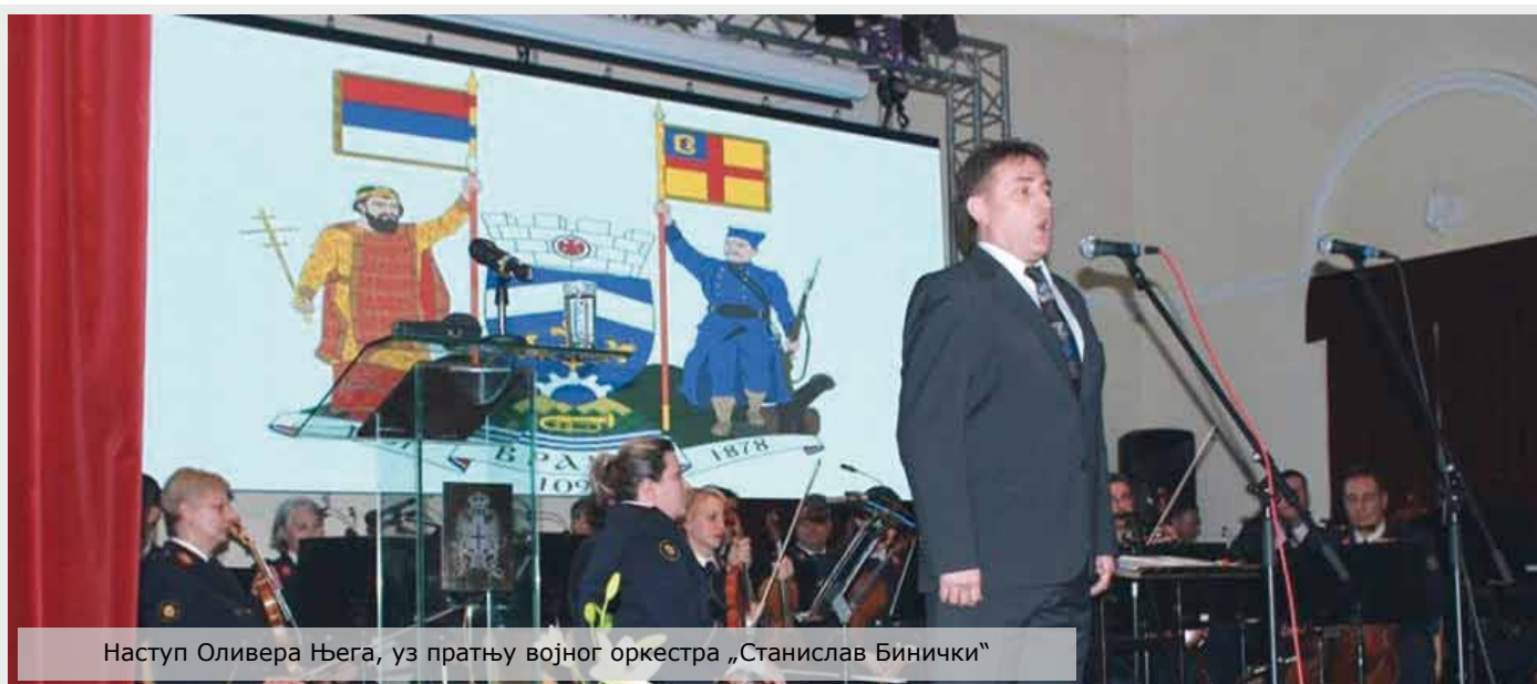
Наступ Оливера Њега, уз пратњу војног оркестра „Станислав Бинички“