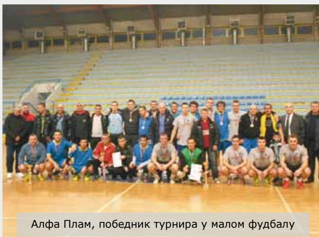
Алфа Плам, победник турнира у малом фудбалу