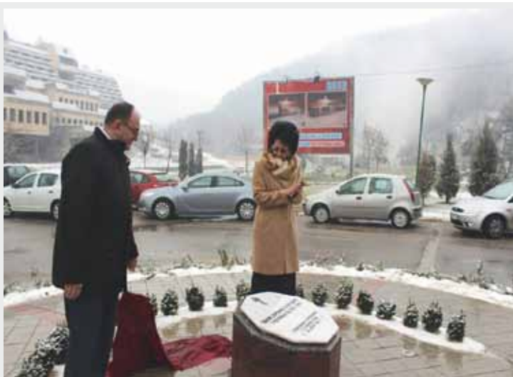
Обележен Дан ослобођења Врањске Бање