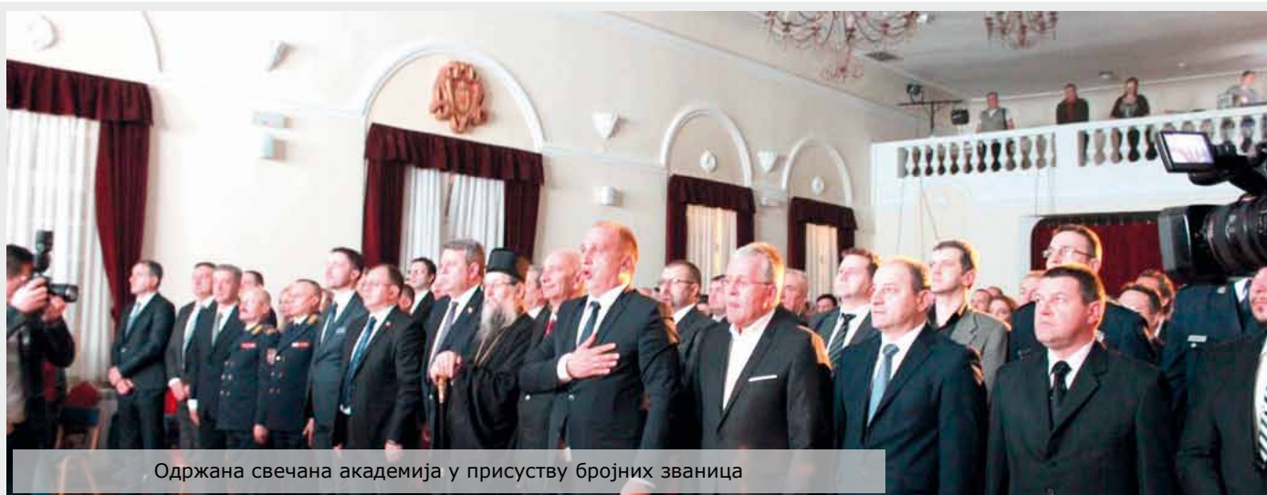
Одржана свечана академија у присуству бројних званица