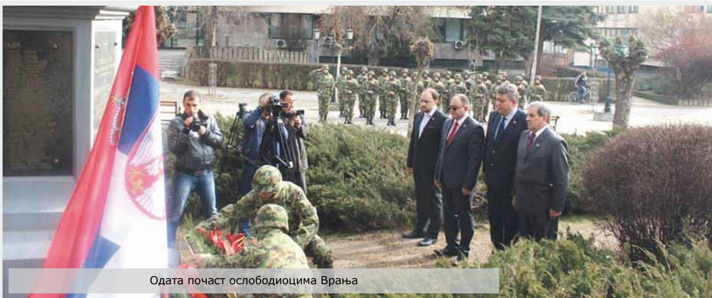
Одата почаст ослободиоцима Врања