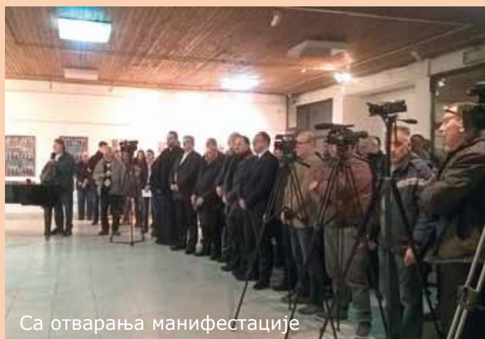
Са отварања манифестације