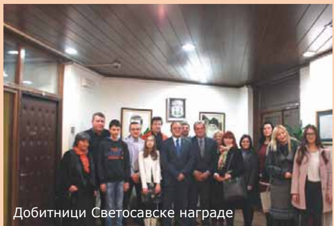
Добитници Светосавске награде