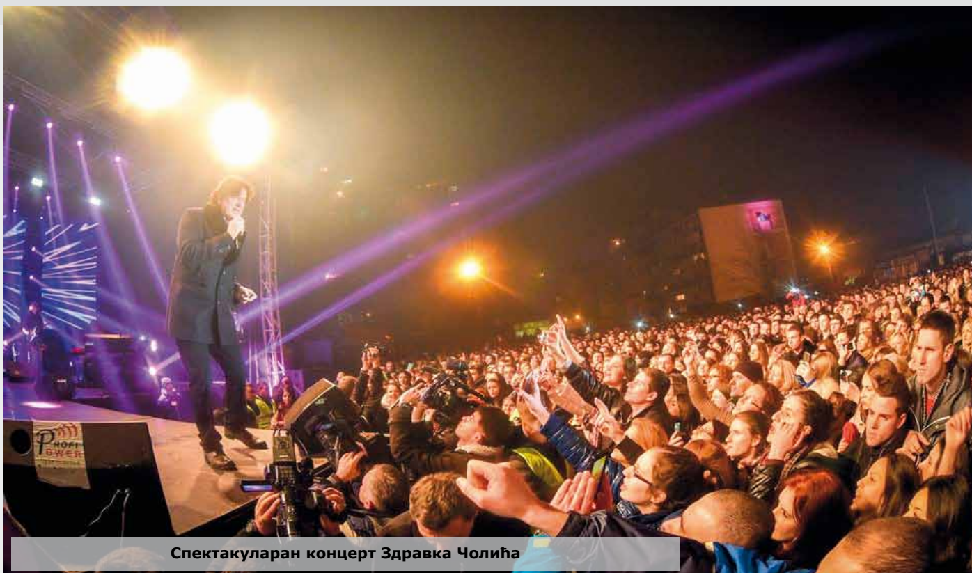
Спектакуларан концерт Здравка Чолића