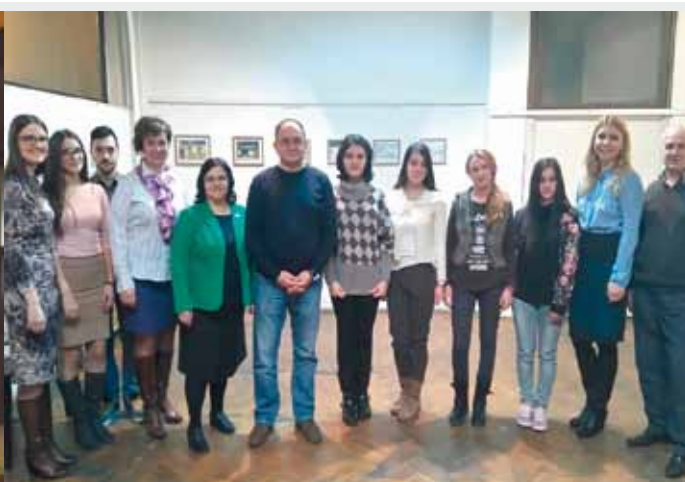
Награђени аутори најбољих литерарних радова