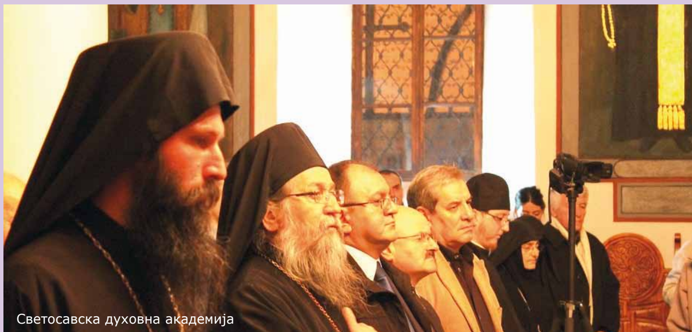
Светосавска духовна академија