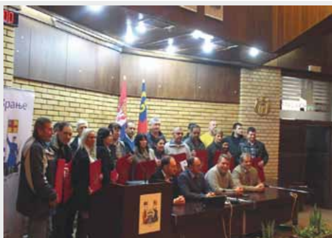
Награђени најбољи радници у јавном сектору