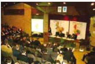
Скупштина Града Врања

У 2011. години наставили смо да унапређујемо рад установа културе и негујемо различитост културно-уметничких манифестација. Спровели смо конкурс за пројекте ванинституционалне сцене и цивилног сектора који се не финансирају из градског буџета као подршку савременом стваралаштву. Унапређење сарадње између установа културе и приватног сектора, са посебим освртом на донаторство и подршку бизниса сектору културе, били су један од приоритета, као и завршетак процеса израде стратегије културног развоја. Остварено је више гостовања у региону и иностранству. Омогућена су већа издвајања из локалног буџета за програме из области културе као и позиционирање града на културној мапи региона, са јасном културном политиком. Резултат свих напора су нове концепције манифестација „Борина недеља“ и „Стари Дани“.