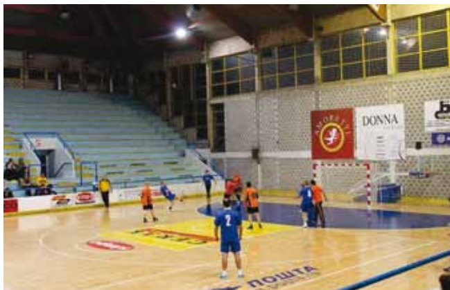
Хуманитарни турнир у малом фудбалу. Победник турнира екипа 4. бригаде Војске Србије. Екипа Града Врања освојила 3. место.