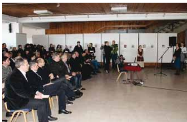
У Галерији Народног музеја, отворена изложба фотографија „Врање – људи и догађаји“, у организацији Историјског архива „31. јануар“.