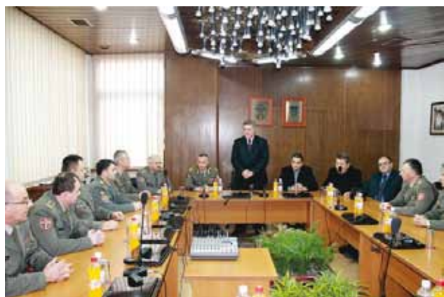
Пријем за припаднике 4. бригаде Војске Србије