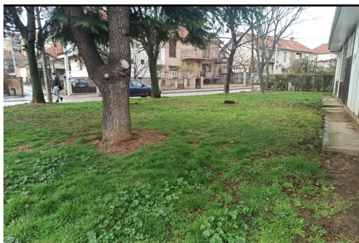
Слика 2 – Парк код I Месне заједнице

Парк код I Месне заједнице заузима површину од 2200м 2 . У саставу парка налази се ограђено дечје игралиште, пешчаник у травнатом делу, пешачке стазе, 1 чесма, кошаркашки терен и парковски мобилијар. Што се тиче зеленила, постоји око 95 стабала дрвећа, како четинарских тако и лишћарских, 13 садница шибља и око 40 садница ружа. Од дрвенастих врста су најзаступљени су јавор, јасен и липа.