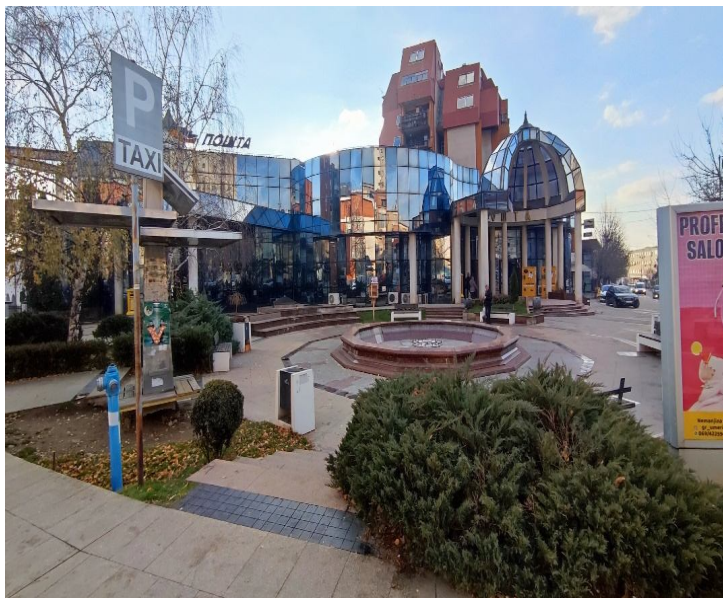
Слике 10 и 11 – Зеленило код Поште

2. Преко пута БАТ-а (Трг братства и јединства)