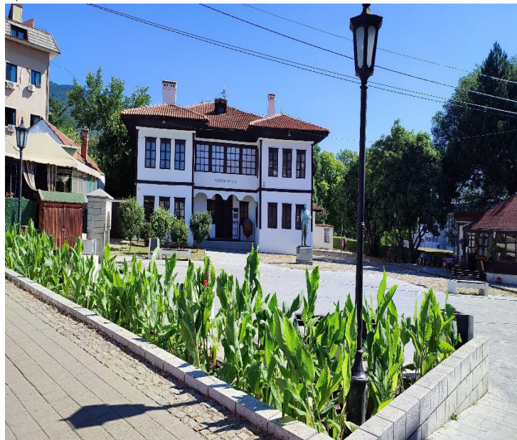
Слика 3 – Трг Станише Стошић

налази се у центру града, а озелењени простор заузима површину од 36 м 2 . Од садница дрвенастих врста присутна је шаренолисна јапанска врста ( Salix integra ) и жбунасте врсте од којих преовлађује шимшир ( Vixus ). По потреби се сади и сезонско цвеће.