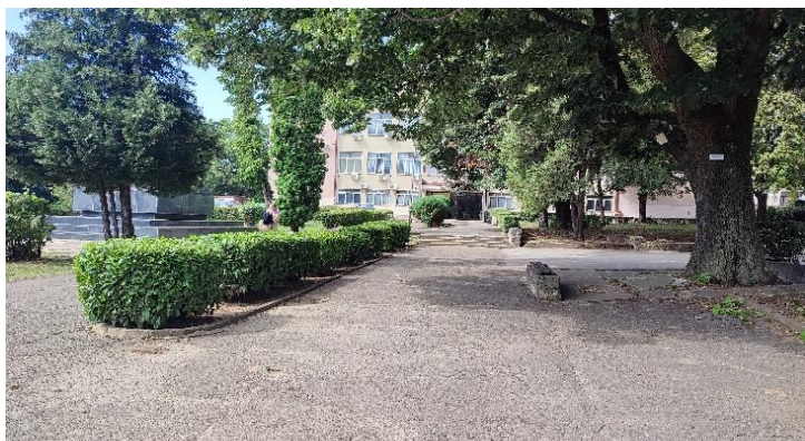
Слике 7 и 8 – Зеленило испред Гимназије „Бора Станковић“