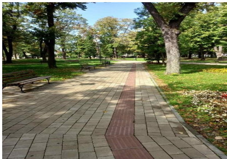
Слика 1 – Градски парк

Градски парк је у програму редовног одржавања ЈКП „Комрад“ Врање, које, између осталог, обухвата одржавање зеленила (редовно подмлађивање – трула, стара и оштећена стабла се замењују младим аутохтоним садницама, ручно окопавање и друго), кошење травњака, сакупљање папира, пражњење корпи за отпатке и друго.