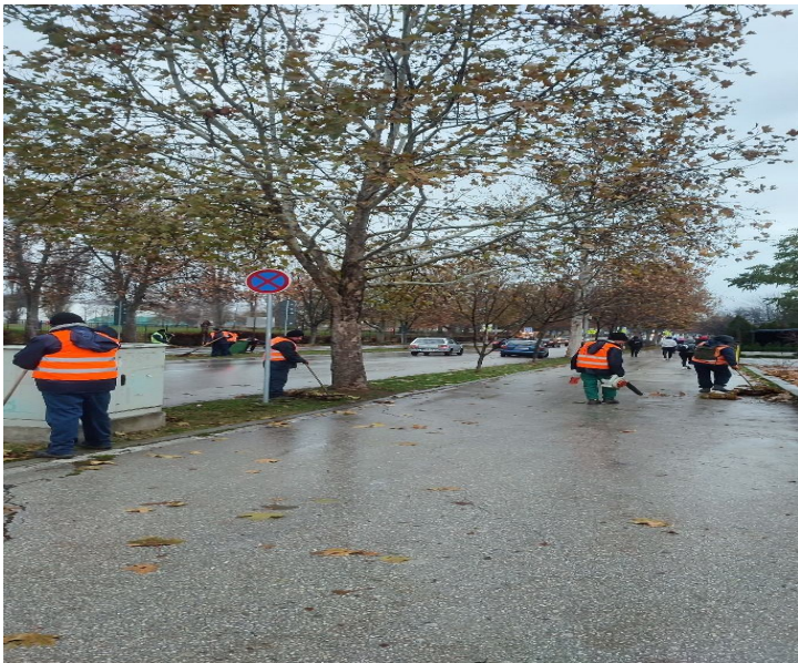
Слика 14 – Дрвореди

Јавне зелене површине у граду Врању које одржава ЈКП „Комрад“ Врање са својим радницима из Пословне јединице Зеленило