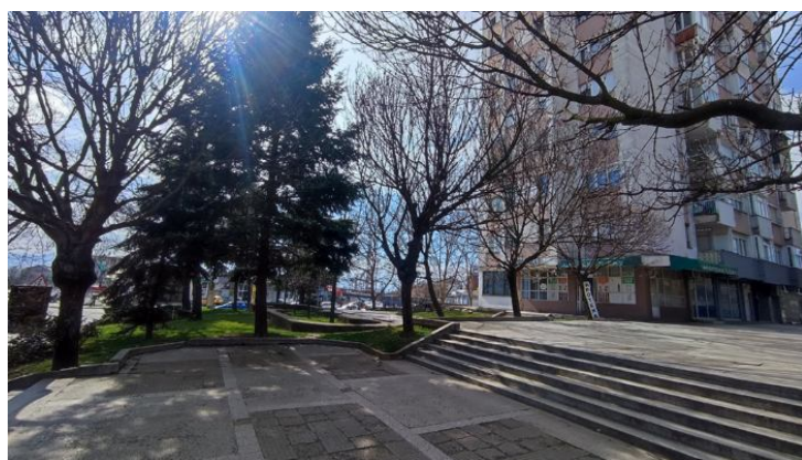
Слике 12 и 13 – Трг братства и јединства Линијско зеленило – дрвореди